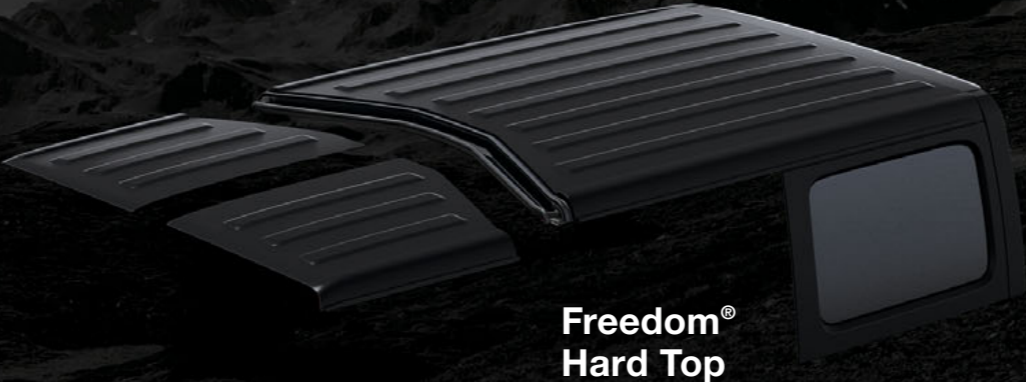
Abbildung zeigt US-Modell.

Sky One-Touch® Power Soft Top: Bei dieser neuen und exklusiv für den Sahara und Rubicon erhältlichen Verdeckvariante, kann das Soft Top – für ein noch komfortableres Open-Air-Erlebnis - ganz einfach per Knopfdruck geöffnet werden.