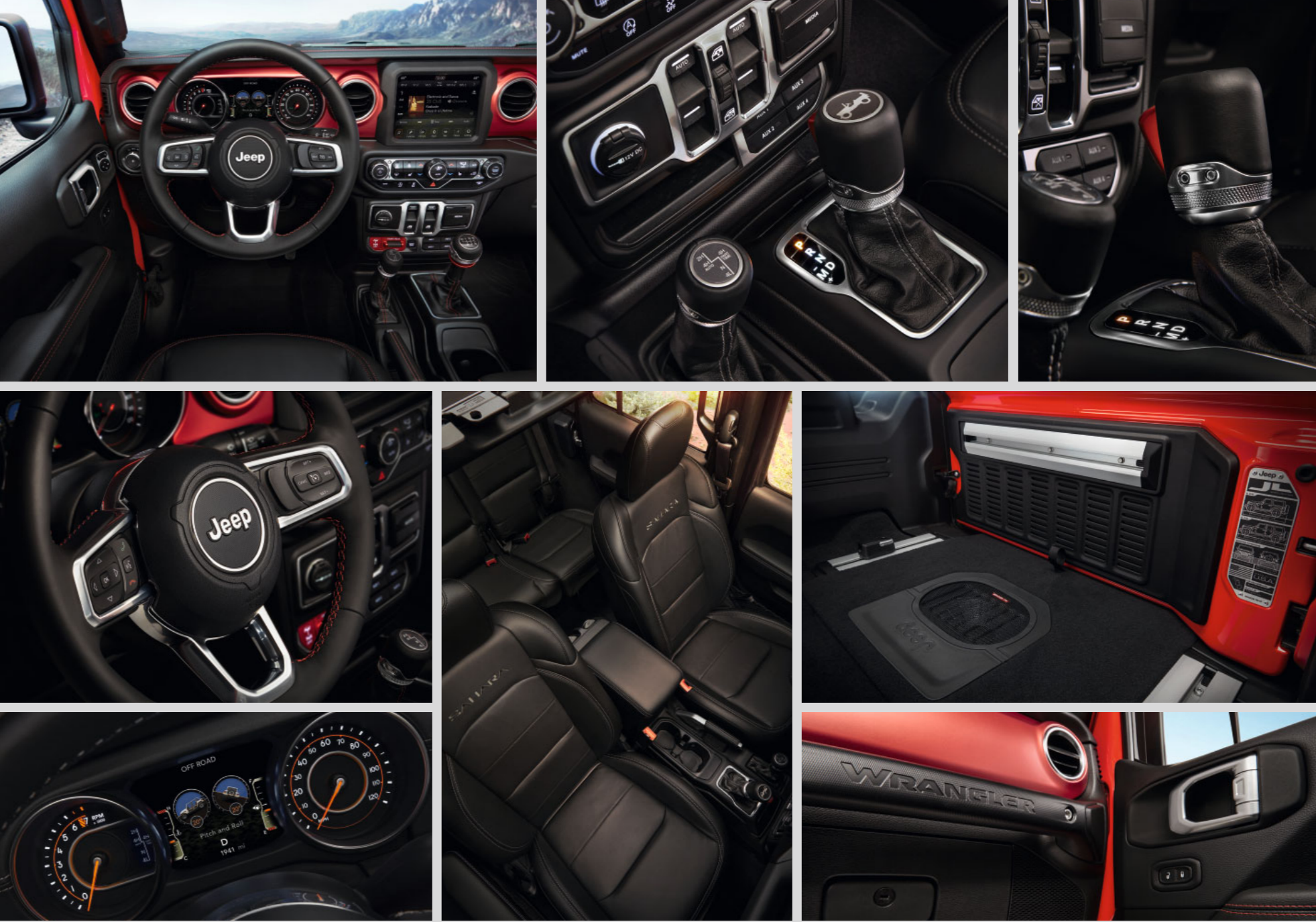
Abbildungen zeigen US-Modell.