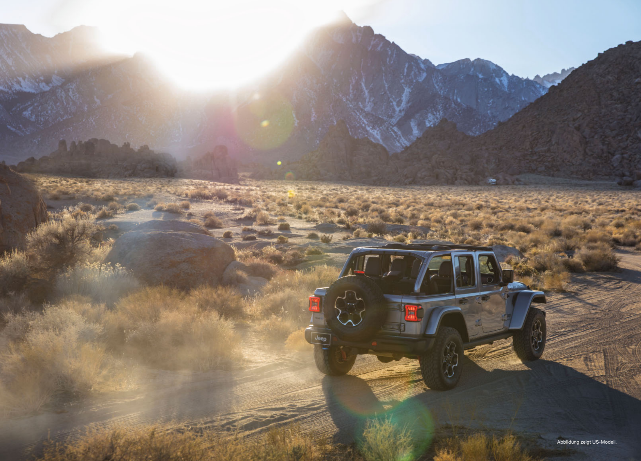
Abbildung zeigt US-Modell.