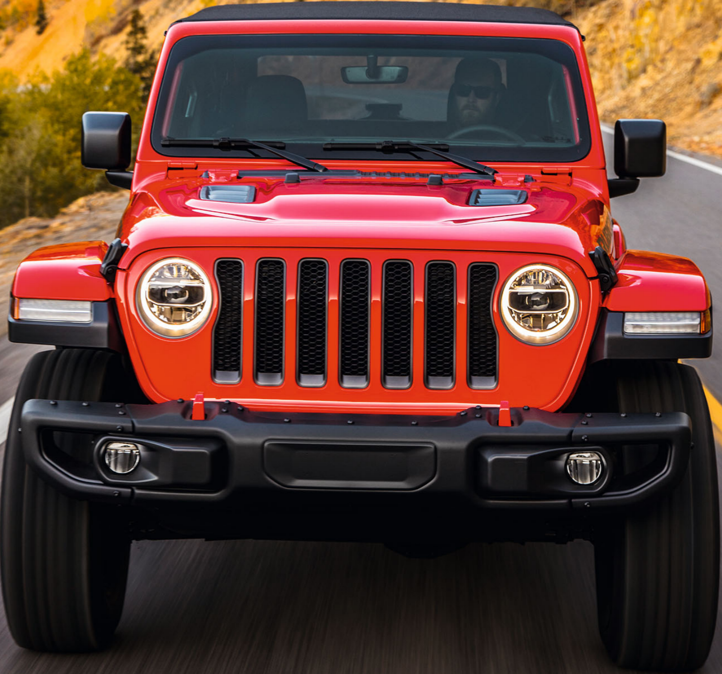
Abbildung zeigt US-Modell.